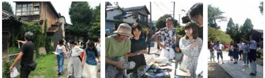
過去の開催の様子