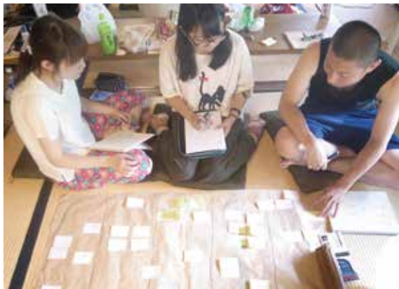
グループによる制作を行います