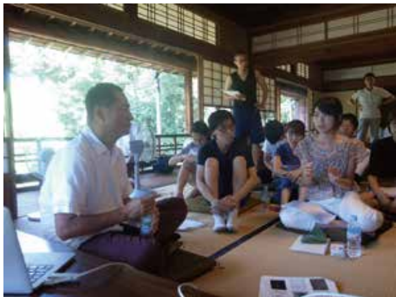
活発なディスカッションが行われます