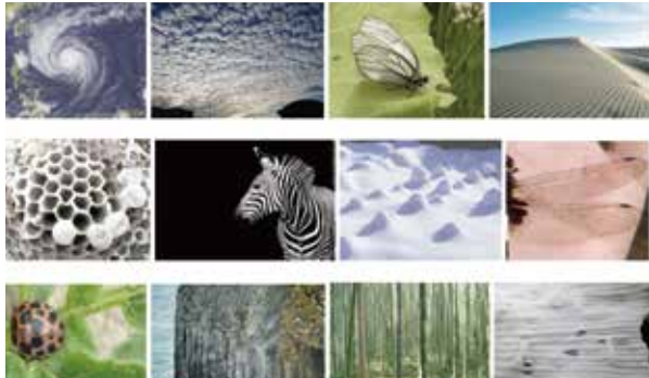
自然界に発見できる摂理・秩序・ルール