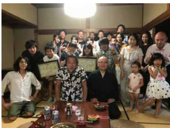
参加者全員での集合写真